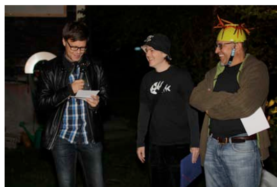
Foto der Pecha Kucha Night