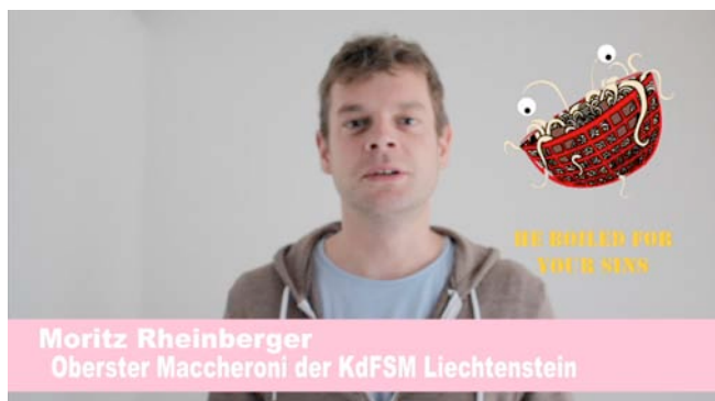
Ausschnitt aus der «Spaghettvision»

Die Öffentlichkeitsarbeit machte einen grossen Teil der Aktivitäten im ersten Kirchenjahr aus. Selbstverständlich wurde bei Vorbereitungstreffen auch auf die Körperheil geachtet und die Obersten PiRäte konnten ihre Qualitäten als Körpersorger unter Beweis stellen. Neben einem Interview im «Weiss»-Magazin und der alltäglichen Überzeugungsarbeit standen zwei Veranstaltungen im Mittelpunkt: Ein Beitrag für die Fasnachtsausgabe von «SchlössleTV» und ein Beitrag für die Pecha Kucha Night im Kulturcafé «Im Bongert».